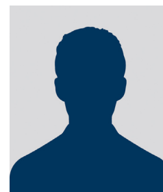
Grégory GARESTIER Conseiller départemental des Yvelines