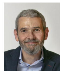
Jean-Francois VIGIER Maire de Bures-sur-Yvette (91)