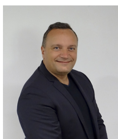
Francisque VIGOUROUX Maire d'Igny (91)