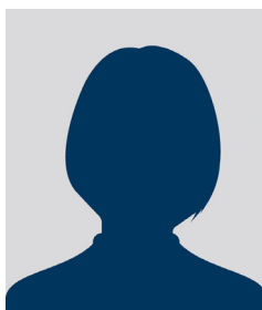
Myriam BRENAC Maire de Chavenay