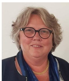
Dominique BOUGRAUD Maire de Lardy (91)