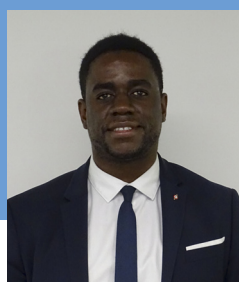
Cédric PEMBA-MARINE Maire de Port-Marly (78)